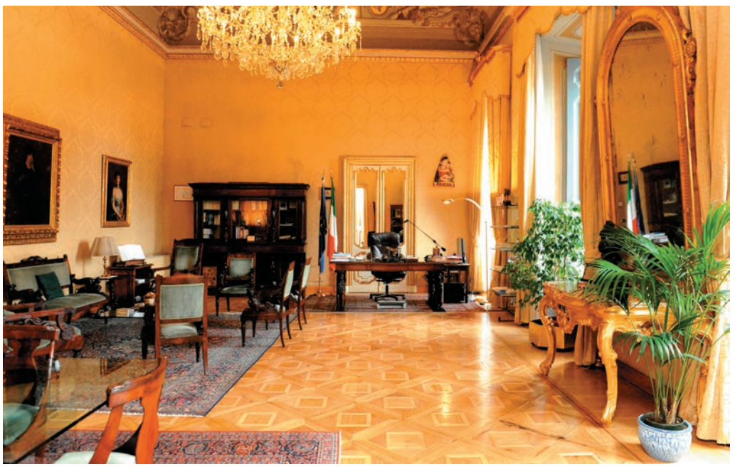
Una veduta dello studio del Presidente.