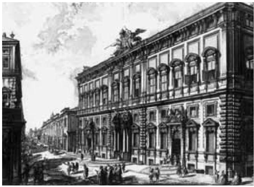
Il Palazzo della Consulta in una celebre incisione di Giovanni Battista Piranesi.

Il sistema incidentale di controllo di costituzionalità fa sì che le leggi non possano essere portate immediatamente e direttamente all'esame della Corte a opera di chi le ritenga incostituzionali. Occorre passare per un giu-