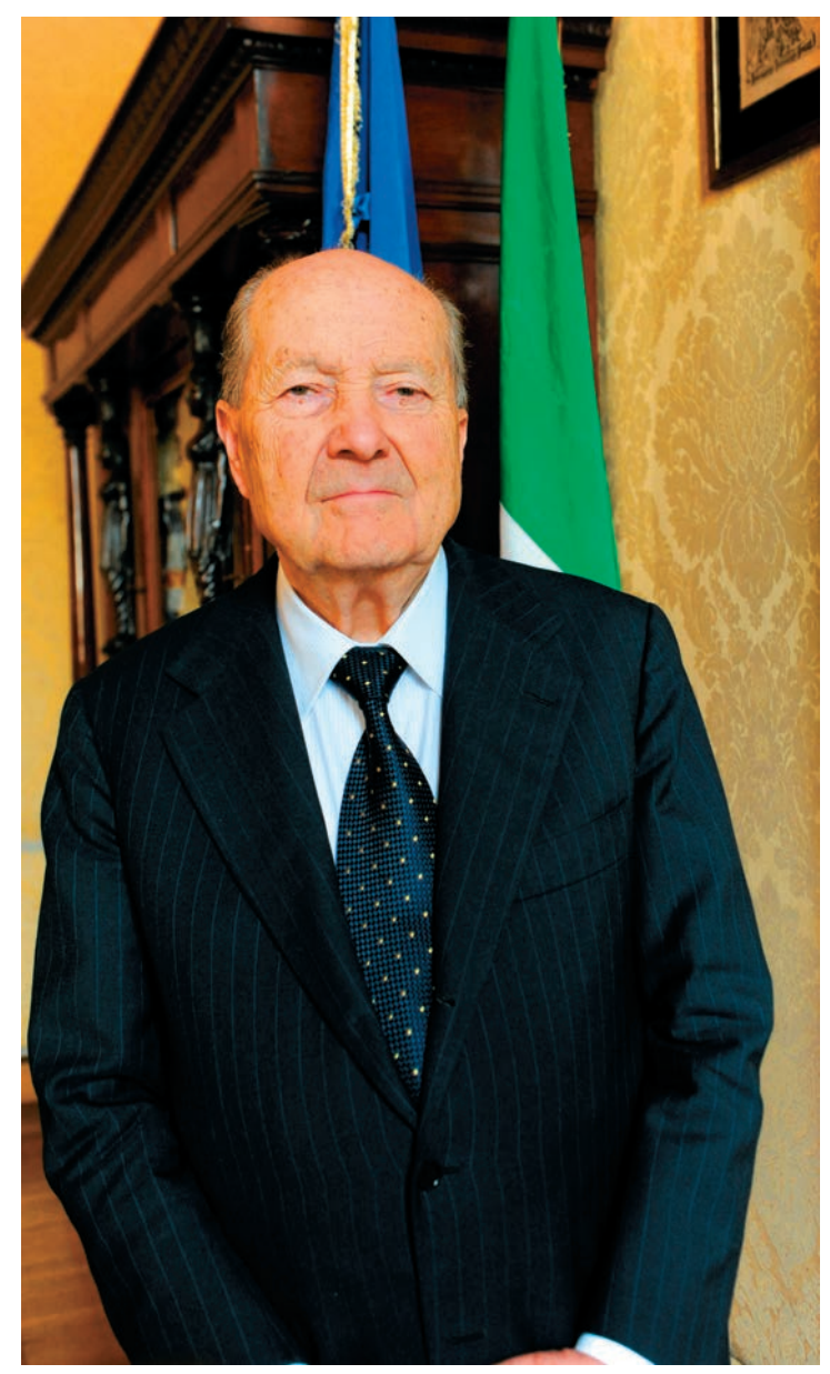
Paolo Grossi, Presidente della Corte costituzionale.