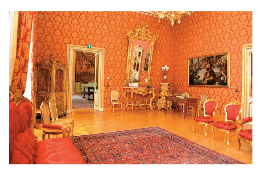
Il Salotto rosso con Le Nozze di Cana del Tintoretto.