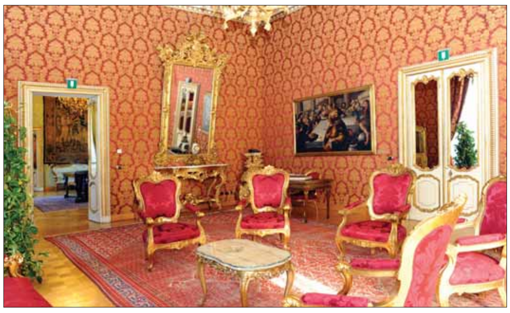
Il Salotto rosso con "Le Nozze di Cana" del Tintoretto.